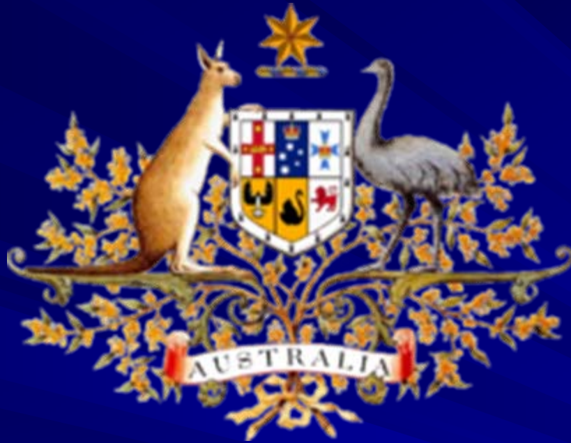
澳大利亞國徽 (袋鼠，鸕鶿)